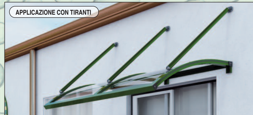
APPLICAZIONE CON TIRANTI