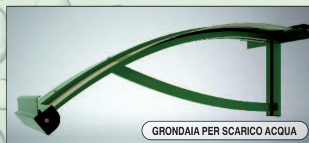
GRONDAIA PER SCARICO ACQUA