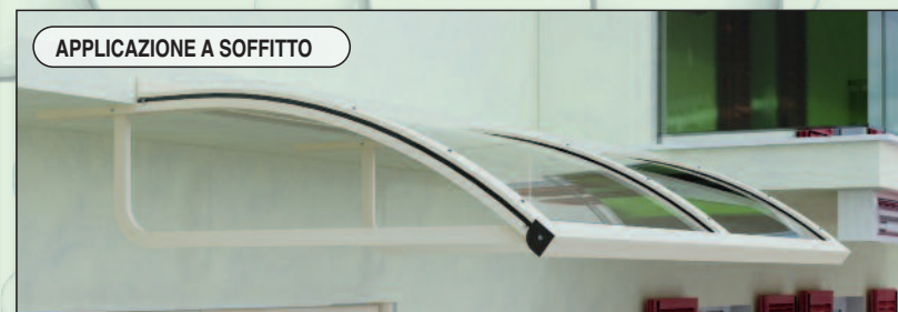
APPLICAZIONE A SOFFITTO