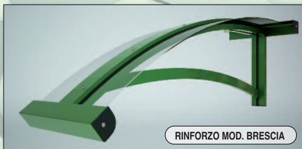
RINFORZO MOD. BRESCIA